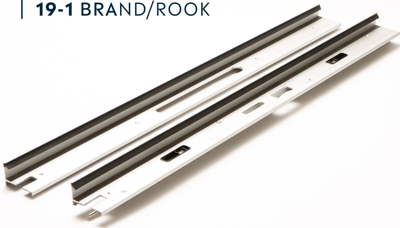
Afbeelding 1. Productfoto uitvoering 19-1 Brand/Rook